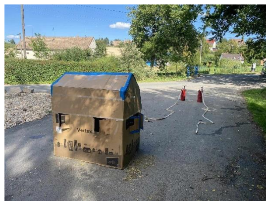
Zásahová jednotka Mouřínov, JPO V